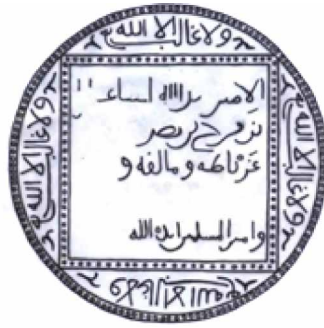
Lámina 2. Reconstrucción parcial del sello de Isma'īl I (A partir de ACA. Cartas Árabes , 25)

5) Muḥammad IV (1325-1333). Su sello mide 75 mm ø. La única huella que queda, con unas migas mínimas adheridas a su borde, está en una carta de 1326 53 .