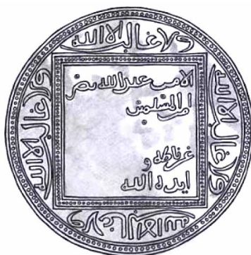
Lámina 1. Reconstrucción parcial del sello de Naṣr 46 (A partir de ACA. Cartas Árabes, Suplemento 7)

Una huella del mismo diámetro se ve en una carta en castellano (1311) dirigida por Naṣr a Jaime II, mandada redactar por «Don Mahomad, consejero mayor del rey» 47 .