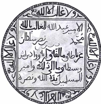
Lámina 4. Reconstrucción parcial del sello de Muḥammad VI. (A partir de ACA. Cartas Árabes, 74)

1 [al-amīr 'Abd Allāh] al-gālib bi-llāh / 2 Muḥammad [b. Isma'īl b. Naṣr] sulṭān / 3 Garnāṭa wa-Mālaqa wa-al-Mariyya wa-Wādī Āš / 4 [wa-Baṣṭa] wa-mā ilā dālika [wa-amīr] / 5 [al-muslimīn] ayyada-hu [Allāh wa-naṣara-hu].