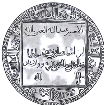
Lámina 3. Reconstrucción parcial del sello de Muḥammad V. (A partir de ACA. Cartas Árabes, 69)