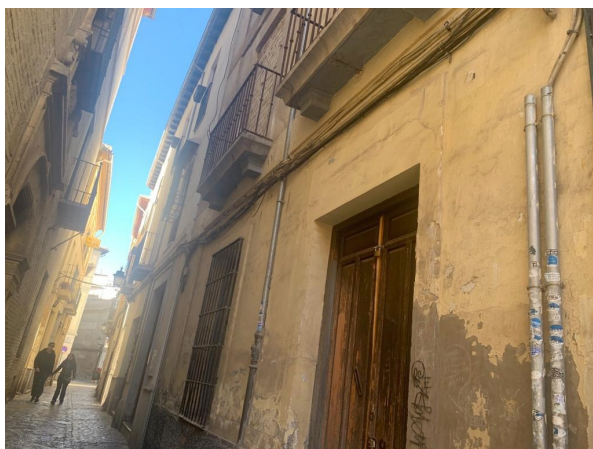
Lámina 1. Calle Escudo del Carmen 81 .