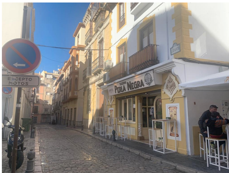
Lámina 6. «Cuarta vivienda» 86 .

Finalmente, otra casa en Maracena, en la zona de las Heras Bajas. Linda con la calle que sale al Camino de Albolote. Esta vivienda, por sus dimensiones, se asemeja más a lo que conocemos en la actualidad como cortijo o chalet. Tenía tierras productivas, viñas y olivos que aprovechaba para su producción 87 . Posee unas dimensiones monumentales, con un corral, huerto de tres marjales y medio y está cercado por tapias. Tiene un corral con huerto de tres marjales y medio y está cercado por tapias. Posee un puesto de viña y algunos árboles frutales con su cuarto de vigas, torrecilla y bodega de tinajas que compró el difunto por bienes de los herederos de Sebastián del Águila. Habiéndola medido consta de ciento cuarenta y cuatro forjas, cuya casa, corral y huerto con sus tapias está valorada en un total de dieciocho mil reales de vellón 88 .