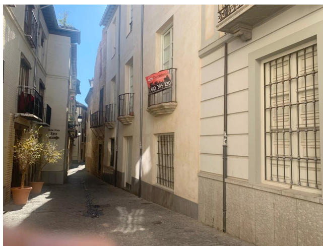
Lámina 4. «Segunda vivienda» 84 .

(1754). (Subiendo desde la placeta, la segunda a mano derecha). Fotografías realizadas por la autora (diciembre, 2021).