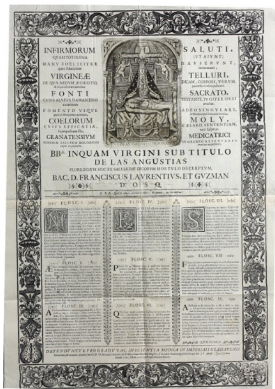
Cuadro 1. Acto de Conclusiones. Localizado en el Archivo Universitario de Granada 12

casa. Había otras estancias privadas donde tenía su propia bodega, algunas tinajas, un corral y un establo donde vivían los mulos que utilizaba para el transporte.