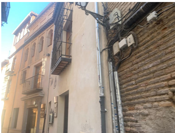
Lámina 5. «Tercera vivienda» 85 .

La casa tiene un umbral en su puerta y tiene de labrado dos mil cuatrocientos cincuenta y siete pies superficiales y está tasada en once mil reales de vellón. Fotografías realizadas por la autora (diciembre, 2021). Fotografías realizadas por la autora (diciembre, 2021).