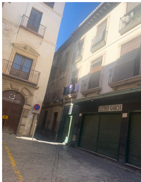
Lámina 2. Plaza de los Peregrinos 82 .